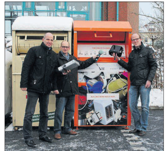
Kleine Elektrogeräte kann man in den Sammelcontainern entsorgen, die an drei Standorten in der Gemeinde Wadersloh zu finden sind. Großgeräte wie Herde oder Kühlschränke werden durch den kostenlosen Abholservice der Gemeinde abgeholt.

Viele der so genannten Schrottsammler, die mit „Tüddüü“ durch die Straßen fahren, handeln illegal: Was da auf dem Pritschenwagen rumpelt oder im geschlossenen Bulli rappelt, darf der „Schrotti“ laut Gesetz oft gar nicht mitnehmen. Das gilt vor allem für Elektroaltgeräte. Diese gehören in legale Hände. Wenn der